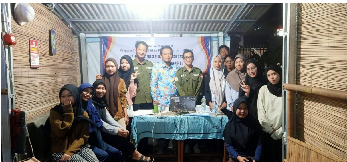
Gambar 1 Pelatihan Jurnalisme Naratif