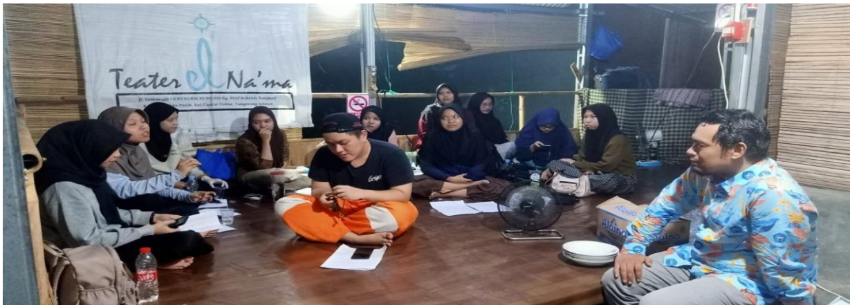
Gambar 1 Pelatihan Jurnalisme Naratif

Kegiatan ini memberikan dampak sosial berupa meningkatnya partisipasi mahasiswa dan masyarakat sekitar dalam kegiatan literasi, serta memperkuat nilai-nilai kebersamaan dan pemberdayaan. Literasi digital yang dipadukan dengan jurnalisme naratif menciptakan ruang dialog yang sehat, sekaligus memperkuat identitas kultural anggota yayasan sebagai komunitas yang literat dan terbuka terhadap inovasi digital.