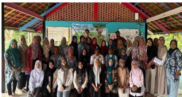
Gambar 4 Dokumentasi Kegiatan PkM Bersama Peserta PkM.

Selain itu, dengan konsistensi dalam penerapan empat kata ajaib yang selalu digunakan dalam percakapan sehari-hari, yaitu kata tolong, maaf, terima kasih, dan permisi. Empat kata ini harus menjadi pembiasaan dalam percakapan keseharian warga di lingkungan RW 007 agar semakin terciptanya lingkungan warga yang santun dalam berbahasa.