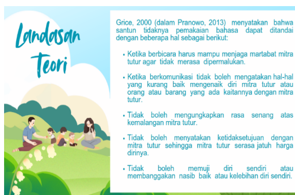
Gambar 1 Teori Grice Kesantunan Berbahasa (Pranowo, 2013)

Keluarga merupakan tempat pertama pendidikan bahasa bagi anak dalam perkembangan bahasa, hal ini menempatkan keluarga sebagai tolok utama mengajarkan kesantunan dalam berinteraksi di lingkungan. Keluarga merupakan unit sosial terkecil dalam masyarakat yang terdiri dari orang terikat oleh perkawinan, hubungan darah, atau adopsi dan tinggal bersama dalam satu rumah tangga. Kaakinen, Coehlo, Steele, & Robinson, 2018; Smith & Hamon, 2017 (dalam (Fatmasari et al., 2020)). Hal itu