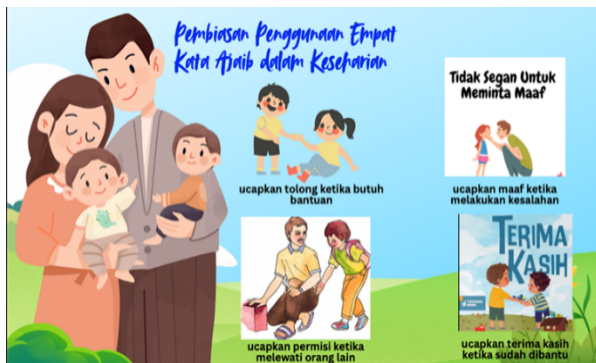
Gambar 3 Contoh Penerapan Empat Kata Ajaib sebagai Wujud Kesantunan Berbahasa

keluarga, dimana hal ini mengingatkan kembali dan menempatkan peran orang tua yang harus selalu menjadi contoh dalam kehidupan sehari-hari dalam berbahasa bagi anak, tidak jarang kecerdasan anak dalam berbahasa dan luntarnya budaya sopan santun dikarenakan gaya interaksi yang sudah mulai berubah tiap generasinya dan adanya faktor kemajuan alat komunikasi dan media sosial yang dimana anak juga lebih banyak berinteraksi dan belajar berbahasa dari apa yang mereka lihat di media sosial dan merebut peran orang tua secara tidak langsung dalam hal mendidik kesantunan berbahasa, khususnya di lingkungan RW 007. Sosialisasi ini lah, memberikan strategi dalam interaksi dan berbahasa yang santun sesuai dengan budaya Indonesia dalam kesantunan berbahasa.