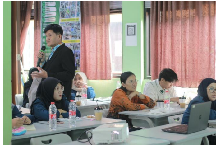
Gambar 4 Pelaksanaan Pengabdian Masyarakat

Berdasarkan berbagai kegiatan pengabdian masyarakat terdahulu tersebut, pelatihan sintaksis fungsional dalam kegiatan PKM ini dirancang tidak hanya untuk memperkuat pemahaman terhadap basic structure , tetapi juga untuk menumbuhkan kemampuan berbicara dan menulis secara kontekstual melalui kegiatan reflektif, kolaboratif, dan partisipatif. Pelatihan ini menggunakan pendekatan Systemic Functional Linguistics (SFL) yang memandang bahasa sebagai sumber makna dalam interaksi sosial (Halliday, 1994; Martin & Rose, 2007). Melalui latihan analisis struktur kalimat dan fungsi gramatikal seperti predikasi, komplemen, dan adjunct, peserta memahami bahwa struktur kalimat memiliki fungsi interpersonal dan tekstual (Eggins, 2004; Thompson, 2014). Dengan demikian, kegiatan PKM ini memperkuat keterkaitan antara teori linguistik dan praktik komunikatif sebagaimana ditunjukkan dalam berbagai kegiatan pengabdian sebelumnya, serta memberikan kontribusi terhadap pengembangan kompetensi sosial dan afektif peserta.