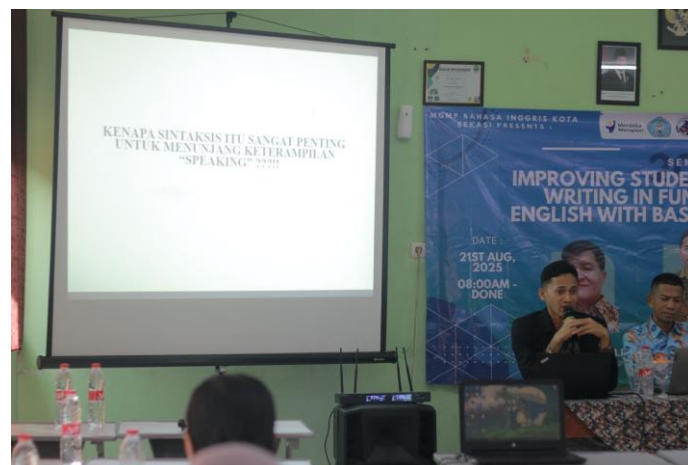
Gambar 1 Pelaksanaan Pengabdian Masyarakat

Sejalan dengan hal tersebut, Whisnubrata et al. (2024) membuktikan efektivitas kegiatan English Conversation Club dalam meningkatkan kemampuan berbicara siswa sekolah menengah melalui aktivitas seperti percakapan dasar, debat sederhana, permainan peran, dan diskusi kelompok. Aktivitas berbasis percakapan ini terbukti tidak hanya meningkatkan kelancaran berbahasa dan penguasaan kosakata, tetapi juga menumbuhkan rasa percaya diri serta keterlibatan aktif peserta dalam proses pembelajaran, yang mencerminkan keterkaitan langsung antara praktik partisipatif dan teori pembelajaran bahasa.