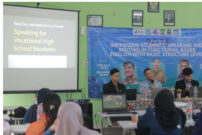
Gambar 2 Pelaksanaan Pengabdian Masyarakat

Model pembelajaran yang dikembangkan Isu et al. (2025) menegaskan bahwa pendekatan berbasis proyek kreatif dapat membangun motivasi intrinsik dan memperluas pengalaman berbahasa siswa dalam konteks yang bermakna. Dengan demikian, baik kegiatan Tambunsaribu dan Danisha (2023) maupun Isu et al. (2025) menunjukkan bahwa aktivitas menulis kreatif tidak hanya memperkuat aspek linguistik, tetapi juga menumbuhkan aspek afektif dan sosial dalam pembelajaran bahasa Inggris, sehingga memiliki kontribusi terhadap perubahan sosial di lingkungan sekolah.