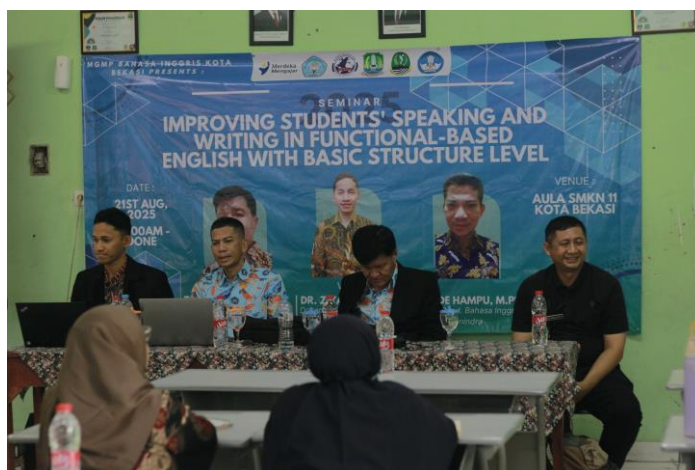
Gambar 3 Pelaksanaan Pengabdian Masyarakat

Selaras dengan itu, Novitasari (2022) juga menegaskan efektivitas strategi diskusi kelompok kecil dalam meningkatkan keterampilan speaking siswa SMA melalui program Kampung Bahasa di Situbondo. Strategi ini terbukti membantu siswa memperbaiki pengucapan, tata bahasa, kosakata, dan kelancaran berbicara melalui praktik kolaboratif yang memberi ruang bagi mereka untuk saling memberi masukan dan belajar menghargai pendapat orang lain. Dengan model ini, peserta tidak hanya memperoleh peningkatan kompetensi linguistik, tetapi juga kepercayaan diri dan kemampuan berinteraksi sosial secara demokratis.