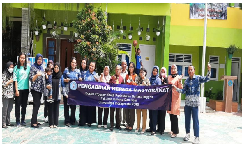
Gambar 1 Tim Abdimas dan Mitra