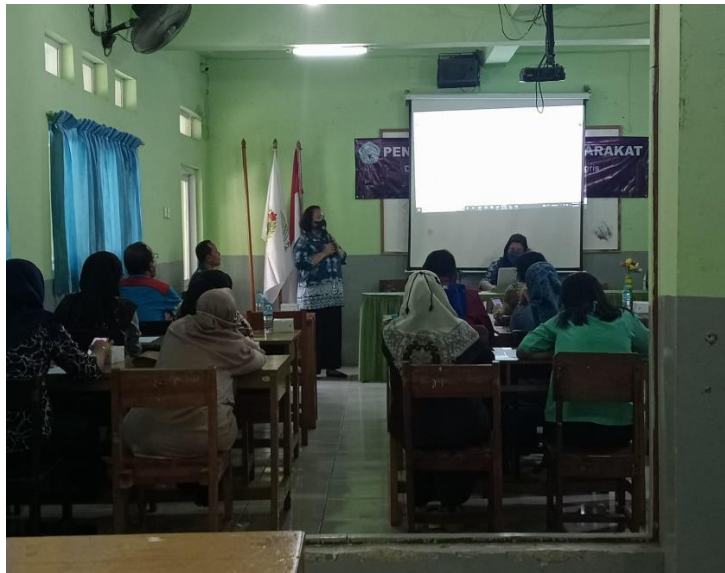
Gambar 1 Pelaksanaan Abdimas