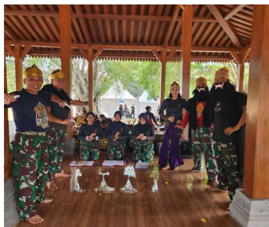
Gambar 9 Beberapa Pelatihan Karawitan