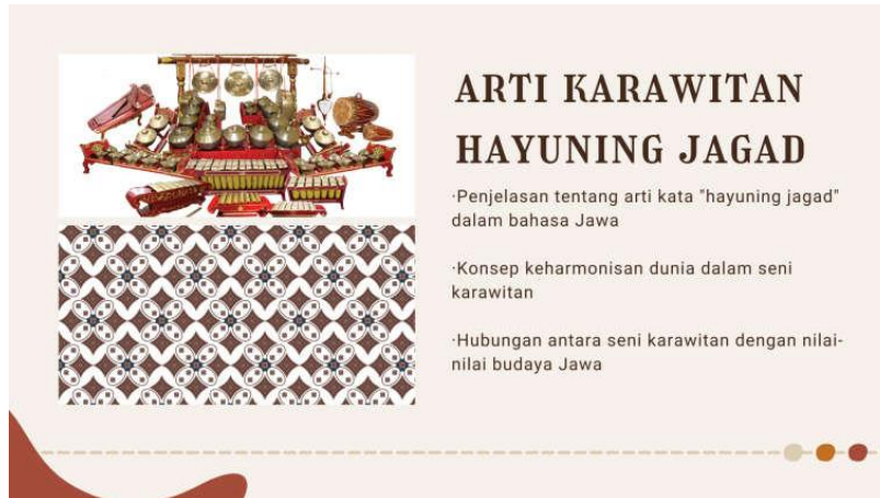
Gambar 4 Penjelasan Karawitan Hayuning Jagad

Setelah menyampaikan hal-hal umum pengenalan terkait seni karawitan, selanjutnya tim pelaksana kegiatan pengabdian kepada masyarakat juga menyampaikan penjelasan khusus sekaligus pengenalan dari seni Karawitan Hayuning Jagad. Pada bagian ini, para peserta kegiatan pengabdian kepada masyarakat mendapat edukasi mulai dari arti kata Hayuning Jagad hingga dikaitkan dengan nilai budaya Jawa. Bagian ini harus dijelaskan dengan seksama kepada peserta karena menjadi poin utama dalam kegiatan pengabdian kepada masyarakat.