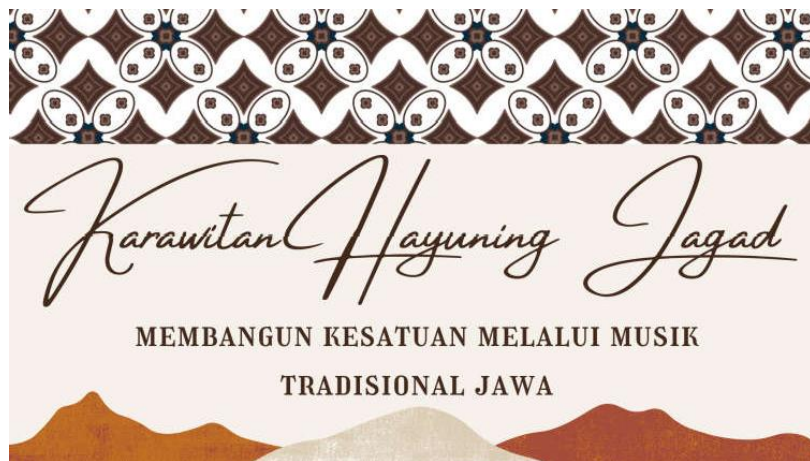
Gambar 1 Slide Pembuka

Pada proses penyuluhan melalui daring, tim pelaksana pengabdian kepada masyarakat menyiapkan materi presentasi dalam bentuk power point . Berikut adalah tampilan materi yang dipresentasikan dalam kegiatan penyuluhan daring: