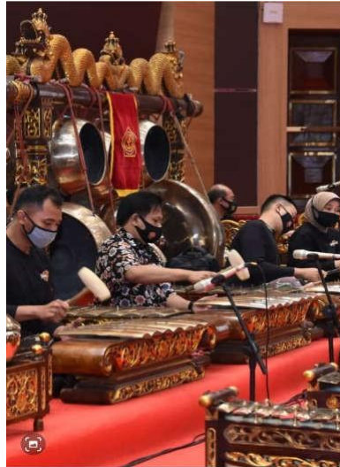
Gambar 7 Kegiatan pelatihan karawitan