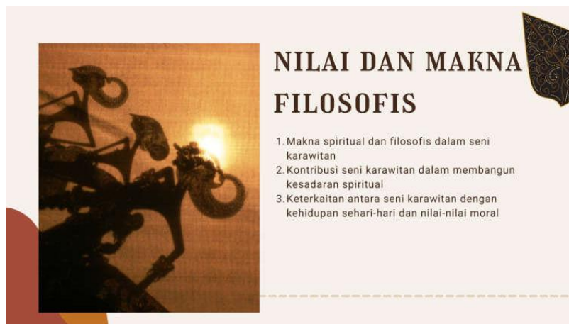
Gambar 3 Nilai dan Makna Filosofis

Bagian berikutnya yang dapat dilihat pada gambar 2, tim pengabdian kepada masyarakat memaparkan hal-hal yang berkaitan dengan sejarah dan asal-usul seni karawitan hingga perkembangan seni karawitan di pulau Jawa. Melalui pemaparan tersebut para peserta kegiatan pengabdian kepada masyarakat mengetahui awal mula adanya seni karawitan hingga perkembangannya saat ini di pulau Jawa.