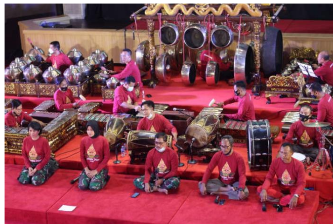
Gambar 8 Kegiatan pelatihan karawitan