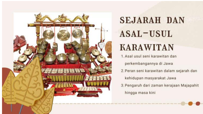
Gambar 2 Penjelasan Sejarah dan Asal-usul Karawitan

Bagian berikutnya yang dapat dilihat pada gambar 2, tim pengabdian kepada masyarakat memaparkan hal-hal yang berkaitan dengan sejarah dan asal-usul seni karawitan hingga perkembangan seni karawitan di pulau Jawa. Melalui pemaparan tersebut para peserta kegiatan pengabdian kepada masyarakat mengetahui awal mula adanya seni karawitan hingga perkembangannya saat ini di pulau Jawa.