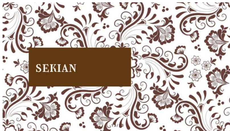
Gambar 5 Penutup

Setelah menyampaikan hal-hal umum pengenalan terkait seni karawitan, selanjutnya tim pelaksana kegiatan pengabdian kepada masyarakat juga menyampaikan penjelasan khusus sekaligus pengenalan dari seni Karawitan Hayuning Jagad. Pada bagian ini, para peserta kegiatan pengabdian kepada masyarakat mendapat edukasi mulai dari arti kata Hayuning Jagad hingga dikaitkan dengan nilai budaya Jawa. Bagian ini harus dijelaskan dengan seksama kepada peserta karena menjadi poin utama dalam kegiatan pengabdian kepada masyarakat.