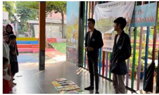
Gambar 2 Sesi menyanyi bersama