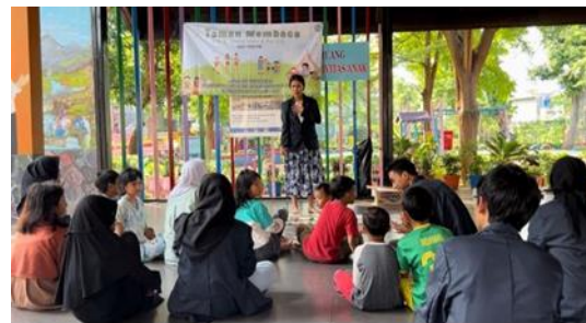
Gambar 8 Sesi pembagian hadiah