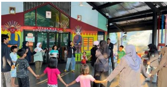
Gambar 7 Sesi games