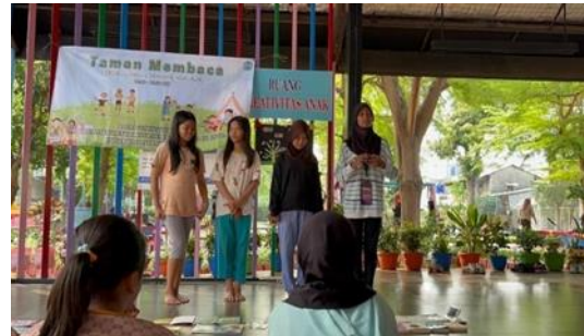
Gambar 4 Sesi refleksi hasil membaca