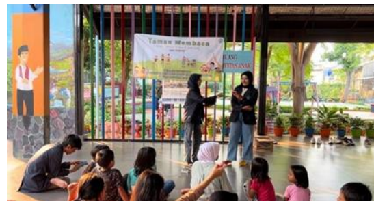
Gambar 6 Sesi ice breaking