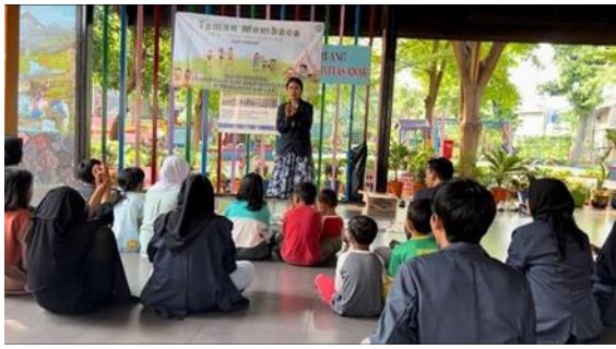
Gambar 1 Pembukaan Kegiatan Literasi