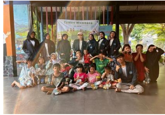
Gambar 9 Sesi foto bersama