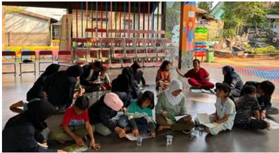
Gambar 3 Sesi membaca senyap/dalam hati