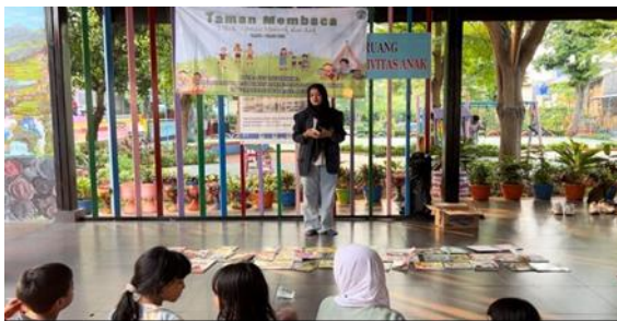
Gambar 5 Sesi mendongeng