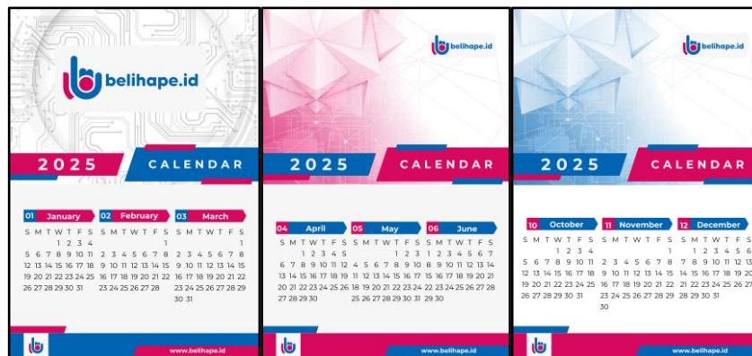
Gambar 1 Hasil akhir desain kalender

Kegiatan pengabdian kepada masyarakat dilaksanakan di Belihape.id, The Villas A16, Jalan Haji Jamat No.47, Buaran, Tangerang Selatan, Banten 15310. Dilaksanakan pada rentang waktu bulan Oktober 2024 sampai dengan Desember 2024. Berdasarkan kesepakatan antara tim pengabdian kepada masyarakat dan mitra. Berikut adalah hasil akhir dari perancangan merchandise kalender Belihape.id yang akan dicetak pada kertas jenis Art paper 150gr dengan spiral kawat berwarna putih pada desain 1 kalender gantung lipat dan kertas Art carton 260gr dengan laminasi doff pada desain 2 kalender gantung.