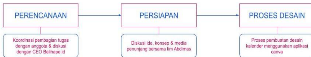
Diagram 1 Alur kegiatan

Kegiatan Abdimas diawali dengan menyusun konsep kegiatan secara keseluruhan, mulai dari pembuatan sketsa desain, pemilihan warna hingga penggunaan visualisasi yang tepat. Kegiatan wawancara juga dilakukan oleh ketua Abdimas dengan CEO Belihape.id, agar perancangan desain dapat disesuaikan dengan dengan filosofi warna dan ciri visual Belihape.id.