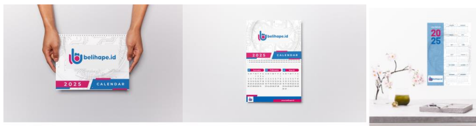
Gambar 2 Mockup merchandise kalender desain kalender lipat dan dinding

Dalam proses evaluasi desain, kami juga membuat mockup yang berfungsi untuk memberikan gambaran realistis mengenai bagaimana desain kalender akan terlihat dalam kehidupan nyata, mempercepat pengambilan keputusan mengenai desain yang disetujui, mengoptimalkan desain dan klien dapat melihat secara lebih jelas apa yang akan mereka terima.