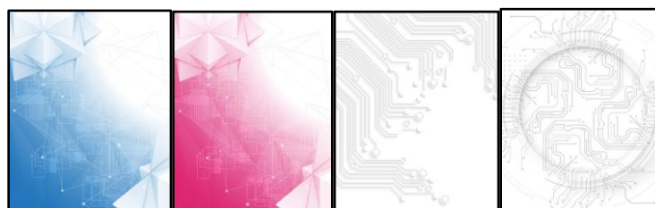
Gambar 5 Variasi dan gradasi warna gambar pada background desain kalender

Gaya desain untuk gambar ilustrasi yang dibuat dalam perancangan desain kalender belihape.id menggunakan gaya flat design dengan desain minimalis. Ciri khas dari flat design yaitu desain yang clean, warna yang digunakan warna-warna cerah, dan penggunaan ilustrasi dua dimensi. Dengan tampilan yang menarik perhatian, flat design akan memberikan kesan modern dan praktis saat dilihat.