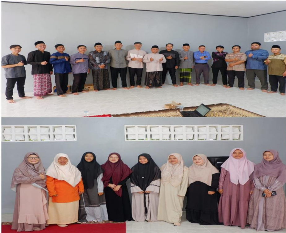
Gambar 4 Pelaksanaan Kegiatan Abdimas