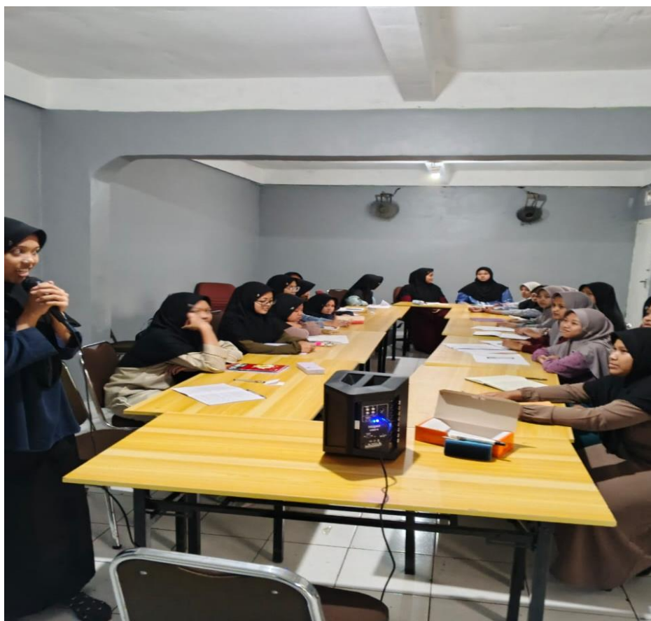
Gambar 2 Pelaksanaan Kegiatan Abdimas

Pelatihan yang diadakan oleh tim abdimas selama enam pekan didisain efektif dengan tidak hanya mengikuti pelatihan secara langsung/Luring namun juga diadakan tambahan secara daring. Penugasan dari setiap materi yang diberikan diadakan untuk menguatkan materi yang telah disampaikan. Tugas praktik berpidato di depan kamera menjadi sarana yang cukup efektif untuk mempercepat kemampuan untuk menaikkan kepercayaan diri peserta pelatihan. Pelatihan diikuti secara antusias oleh setiap peserta dan semarak. Peserta pelatihan mendapatkan cara baru dalam mengembangkan kemampuan berkomunikasi verbal yang selama ini belum pernah dicoba.