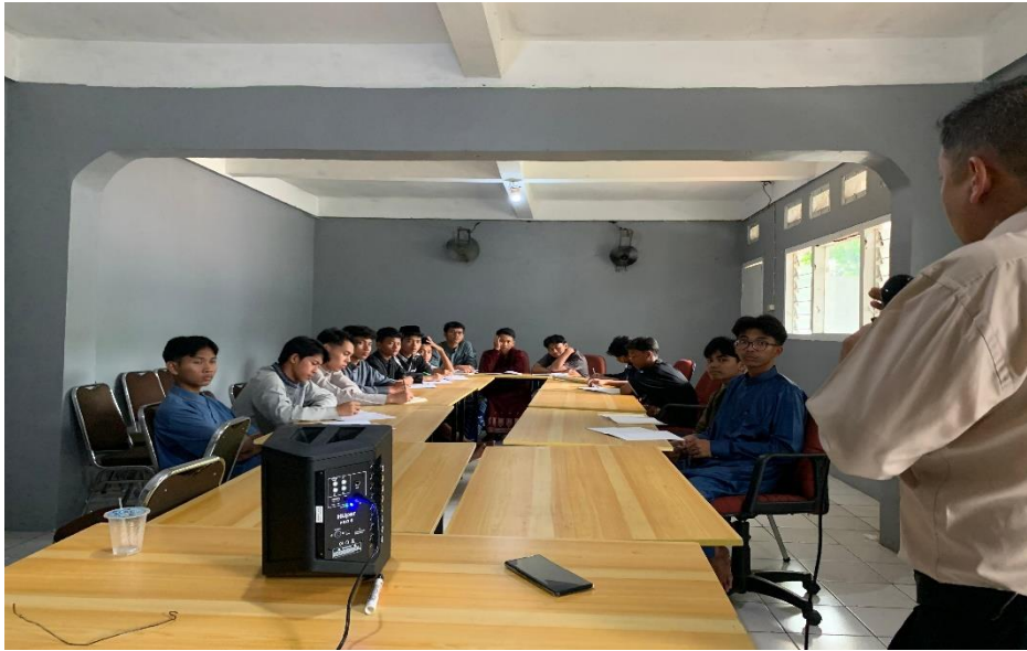
Gambar 3 Pelaksanaan Kegiatan Abdimas

Praktik dalam menyusun kata-kata yang tepat sesuai dengan etika dan akhlak Islami diberikan pada pekan ketiga (Joko Susanto, 2020). Menyusun kata dan merangkainya menjadi kalimat yang baik tidak mudah dilakukan. Hal ini menjadi masalah yang banyak dirasakan peserta. Setelah pelatihan oleh tim abdimas dilakukan, peserta memiliki kiat-kiat khusus dalam menyusun kata menjadi kalimat yang baik beretika dan sesuai dengan akhlak Islami. Peserta juga diberikan cara-cara khusus agar lebih mudah dalam menyambungkan kalimat satu dengan kalimat lainnya.