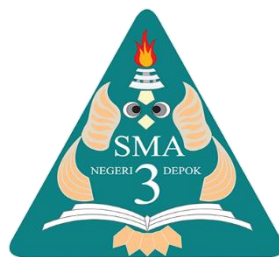
Gambar 1 Logi SMA Negeri 3 Depok

Terdapat ikon buku berjumlah tiga buah, yaitu yang teratas adalah buku suci atau kitab suci, yang kedua adalah buku non fiksi, dan yang ketiga adalah buku fiksi. Warna Merah pada ikon gambar api melambangkan semangat, berani, dan gagah. Biru sebagai warna dasar logo merupakan warna cakrawala lambang dari pandangan yang luas, terang, mantap, cinta yang abadi, dan setia. Putih untuk warna huruf sekolah dan buku adalah lambang dari kesucian, kebersihan, cita-cita yang luhur. Kuning untuk warna sayap dan ekor lambang dari warna bahwa pengetahuan itu sangat berharga maka dengan sayap yang mendapat ilmu pengetahuan disekolah, kemanapun terbang akan mendapatkan penghargaan. Logo tersebut dibuat oleh Dra. Hj. Nunu Nuraesih (Alm) selaku Kepala SMA N 3 Depok ke-2 pada tanggal. 23 Desember 1995 (berdasarkan website SMA Negeri 3 Depok, http://sman3depok.sch.id/pengenalan-lambang-sman-3-depok/ , yang dikutip pada 8 Agustus 2022).