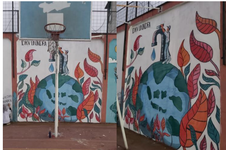
Gambar 6 Hasil Akhir Mural