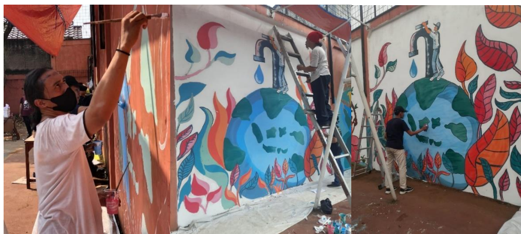
Gambar 6 Tahap Pewarnaan Mural Hemat Air

Widya Nuriyanti dan Nurulfatmi Amzy mengawasi dan mengontrol ketersediaan cat, pigmen dan kuas yang dibutuhkan agar tidak terjadi kekurangan bahan lalu menyiapkan konsumsi agar kegiatan berjalan lancar.