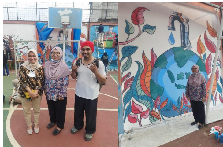
Gambar 7 Tim Abdimas