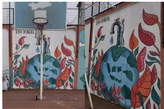
Gambar 6 Hasil Akhir Mural