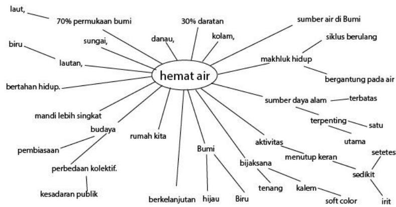
Gambar 2 Mindmapping Tematik hemat air