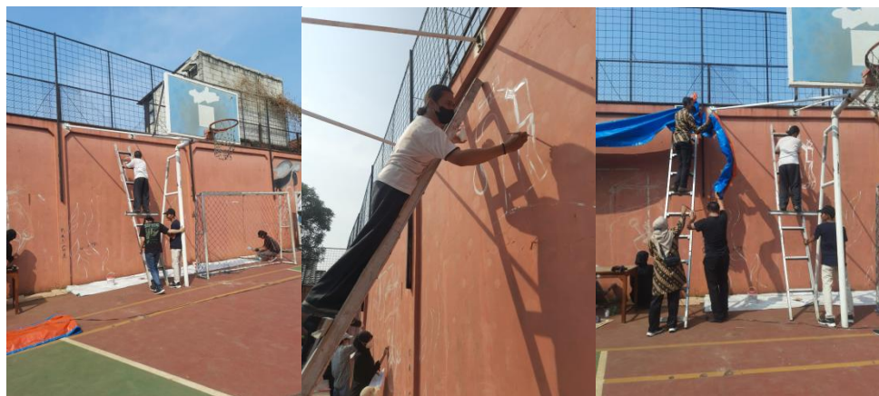
Gambar 5 Tahap sketsa pada tembok

untuk memulai kegiatan dan menjelaskan secara umum mengenai rangkaian acara dan gambaran desain mural yang telah disepakati bersama.