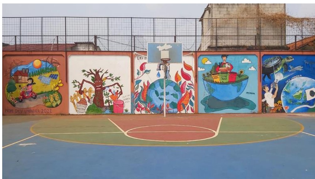
Gambar 8 Tampak Posisi Tembok Mural Hemat Air