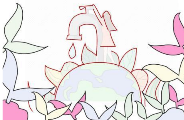
Gambar 4 Sketsa Mural Hemat Air

Saat pelaksanaan kegiatan, tim pelaksana dan mahasiswa datang ke SMA Negeri 3 Depok tepat pada pukul 08.00 WIB. Tim pelaksana menemui pihak sekolah terkait izin