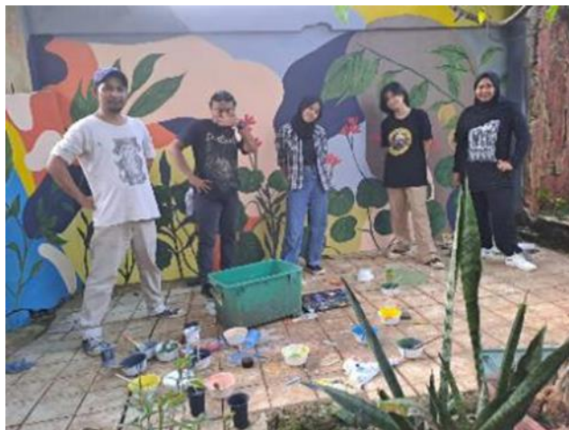
Gambar 7 Tim Abdimas Sumber: Dokumentasi Pribadi, 2022