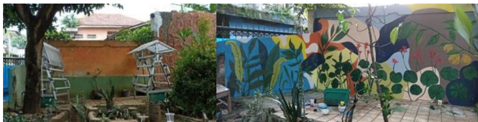
Gambar 6 Lokasi Sebelum dan Sesudah Mural