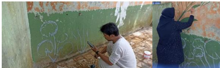
Gambar 5 Kegiatan Mural oleh Tim Unindra