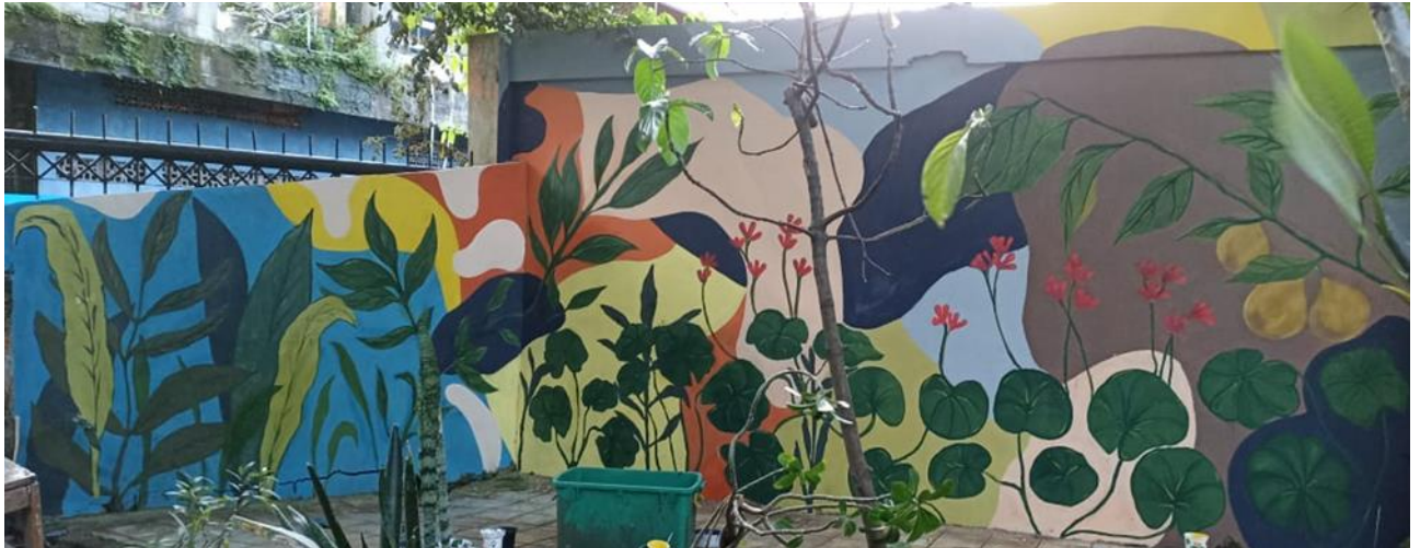
Gambar 3 Hasil Mural perubahan iklim global: Dokumentasi Pribadi, 2022 MURAL