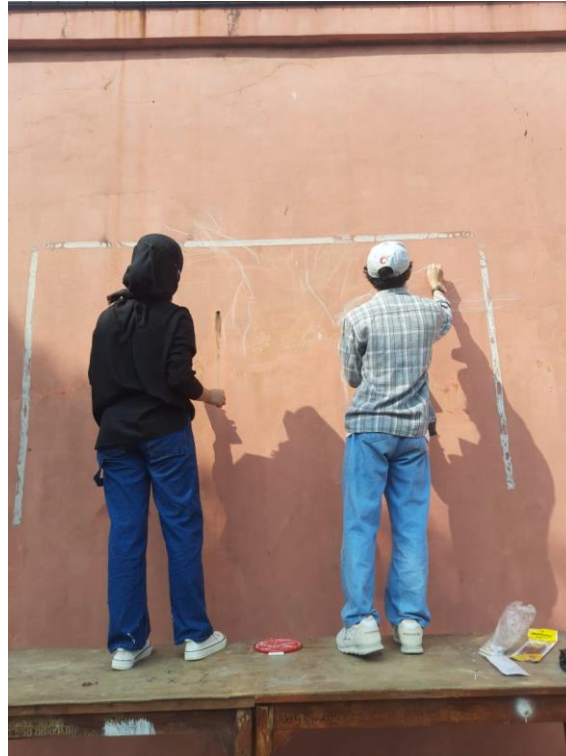
Gambar 2 Mahasiswa Menerapkan Sketsa di Tembok

Komunikasi Visual Universitas Indraprasta PGRI. Capaian ketiga adalah terjadinya kolaborasi dalam mewujudkan visual peduli lingkungan, pihak sekolah memberikan tema, pihak pelaksana pengabdian kepada masyarakat menganalisis, mengelaborasi, mengaplikasikan dan mempraktikkannya.