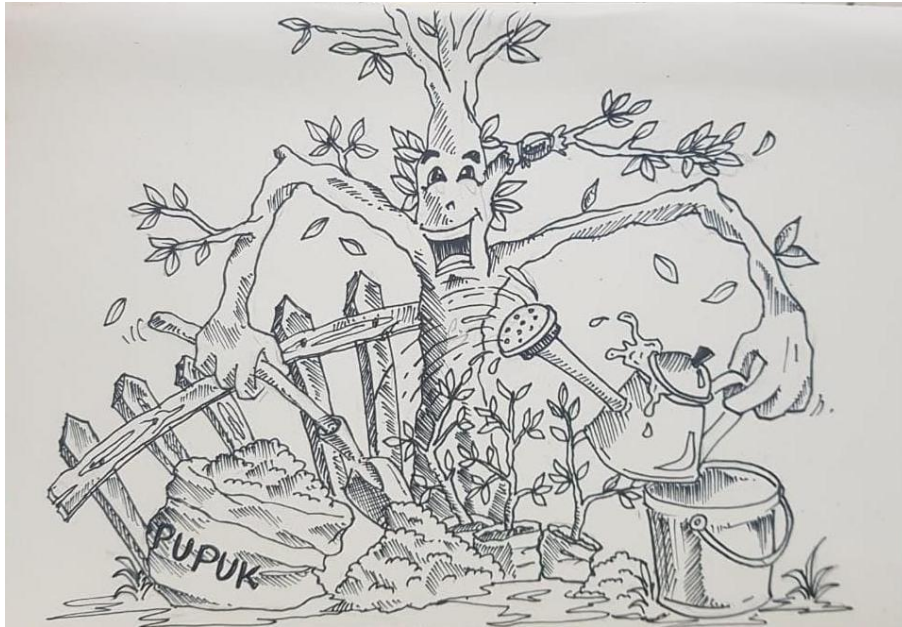
Gambar 1 Sketsa Merawat Tanaman

Sketsa tersebut dicetak dan menjadi model untuk membuat mural. Pelaksanaan mural dilakukan oleh seluruh tim dosen dan dibantu oleh dua orang mahasiswa.