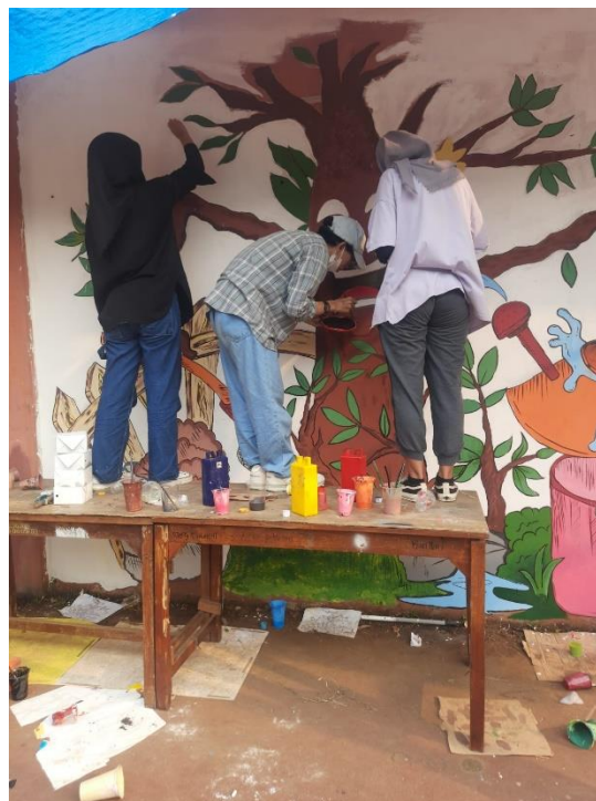
Gambar 3 Mahasiswa DKV Unindra membantu pengerjaan mural