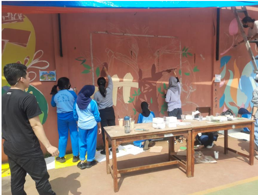
Gambar 4 Beberapa Siswa SMAN 3 Depok Terlibat Mural

Sebagaimana terlihat pada Gambar 2 di atas, mahasiswa DKV Unindra terlibat secara sukarela dalam proses pembuatan mural. Gambar tersebut memperlihatkan dua orang mahasiswa tengah menerapkan sketsa yang telah disiapkan pada tembok. Selanjutnya, pada Gambar 3 di bawah, para mahasiswa membantu pengerjaan mural hingga selesai. Melalui kegiatan ini, mahasiswa bukan hanya berpartisipasi dalam kegiatan pengabdian kepada masyarakat, melainkan sekaligus memperdalam ilmu yang telah mereka pelajari di Program Studi DKV melalui praktik pembuatan mural. Pengetahuan dan konsep dasar dalam keilmuan DKV yang telah mereka pelajari, seperti konsep tentang warna, komposisi, dan desain karakter, coba dipraktikkan melalui kegiatan ini.