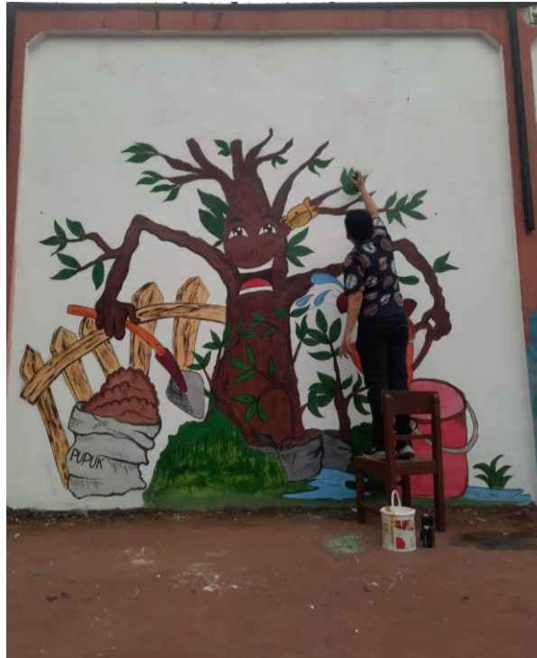
Gambar 5 Finishing Mural

Proses penyelesaian ( finishing ), sebagaimana terlihat pada Gambar 5, dilakukan oleh salah satu dosen pelaksana yang memang memiliki kemahiran dan kualifikasi di bidang Desain Komunikasi Visual.