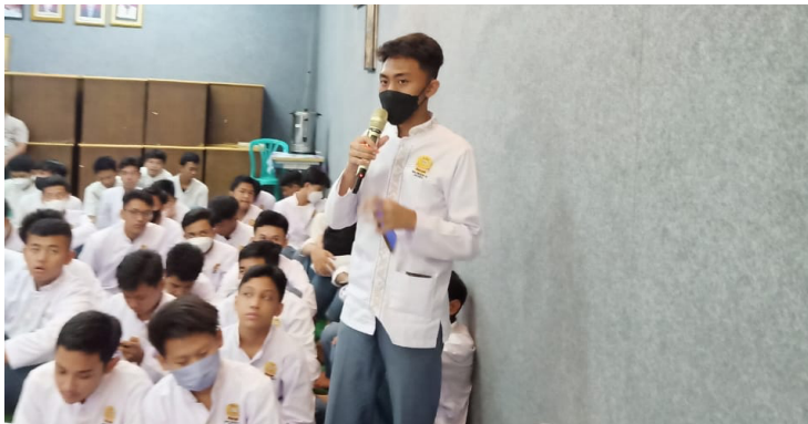
Gambar 7 Interaksi Siswa (2)