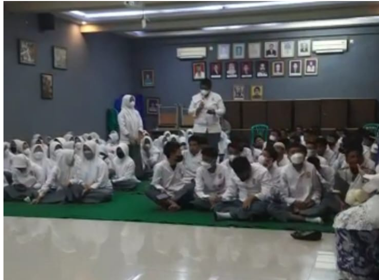
Gambar 9 Interaksi Siswa (4)

Sumber: Dokumentasi Puri Kurniasih, 16 September 2022.