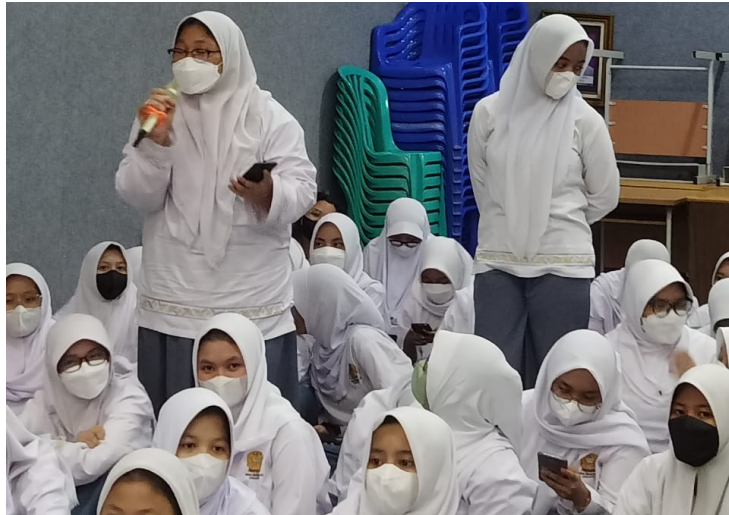
Gambar 6 Interaksi Siswa (1)