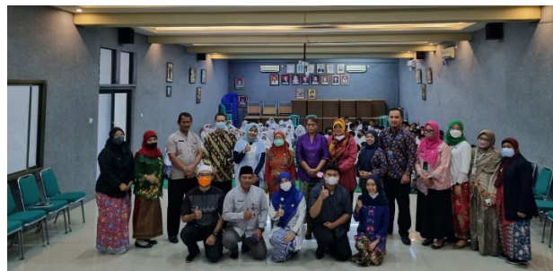
Gambar 2 Pelaksanaan Sesi 1: Guru, Narasumber, dan Komite Sekolah.

Kegiatan Pengabdian Masyarakat Program Kemitraan Masyarakat, menghasilkan beberapa capaian. Capaian pertama adalah kegiatan berupa presentasi interaktif yang interaktif antara narasumber – Tim Dosen dengan peserta – Murid, Guru, dan Orang Tua Murid yang dilaksanakan di lingkungan SMAN 51 Jakarta. Capaian kedua adalah terjalinnya Kerjasama antara institusi pendidikan sekolah menengah atas dengan pendidik di tingkat Universitas, SMAN 51 Jakarta dengan Tim Dosen Program Studi Desain Komunikasi Universitas Indraprasta PGRI. Pencapaian ketiga adalah mewujudkan program Kurikulum Merdeka, yaitu melalui kegiatan dalam Proyek Profil Pelajar Pancasila. Berikut adalah dokumentasi kegiatan pada saat pelaksanaan: