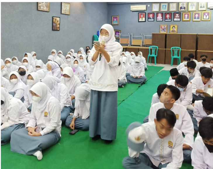
Gambar 8 Interaksi Siswa (3)