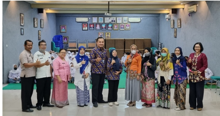
Gambar 3 Pelaksanaan Sesi 2: Guru, Narasumber, dan Komite Sekolah.