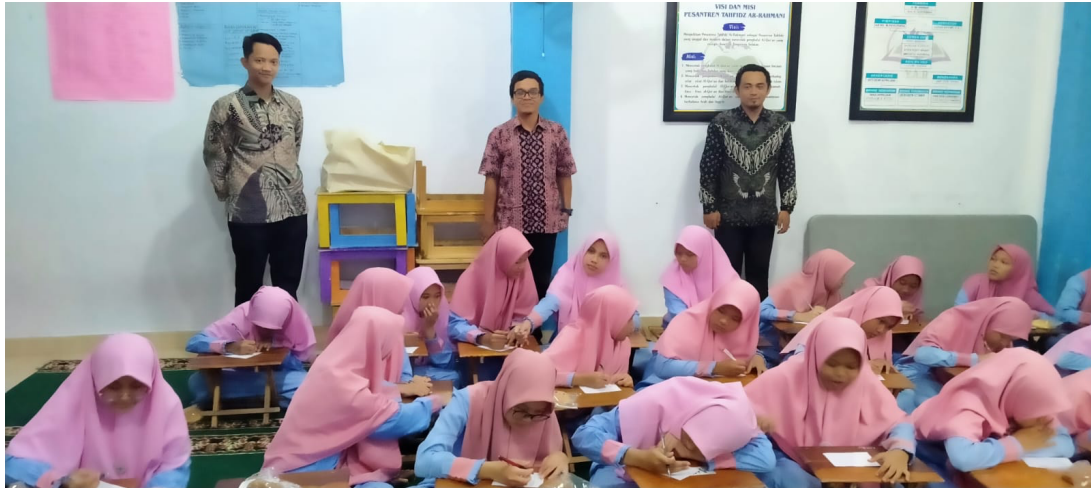
Gambar 1 Pelatihan Teknik Membaca Syair

Saat dilakukan posttest atau tes akhir, keenam belas peserta mampu menjawab soal tes dengan baik. Dari 25 peserta, terdapat 20 peserta mampu membacakan dengan teknik yang sesuai di atas 50%. Sedangkan 5 peserta lainnya masih di bawah 50%.