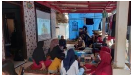
Gambar 7 Pelatihan Pengemasan dan Pemasaran

Kegiatan pelatihan pengemasan dan pemasaran ini dilakukan pada tanggal 24 September 2023, pukul 14.00-15.30 WIB, yang berlangsung di kediaman ketua RW 04 Cilangkap. Kegiatan dibuka dengan penyampaian mekanisme cara menjual produk di Shopee dimulai dari cara mendaftar akun hingga cara menerima pesanan yang masuk. Kemudian, tim memberikan kesempatan bagi mitra untuk melakukan pendaftaran akun Shopee secara langsung. Setelah itu, dilakukan tanya jawab mengenai penjualan minuman herbal yang efektif. Sehingga dapat disimpulkan bahwa respon peserta terhadap pemasaran untuk usia lanjut menunjukkan bahwa mereka biasanya lebih tertarik dengan pemasaran secara langsung. Tim bersama mitra juga telah menentukan harga jual produk minuman herbal instan dalam bentuk serbuk yaitu Rp3.500/sachet dan kantung teh Rp25.000/pouch isi 10.