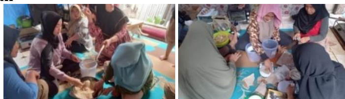
Gambar 6 Pelatihan Pengolahan Tanaman Rimpang