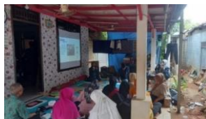
Gambar 3 Edukasi Pembudidayaan dan Pengolahan Rimpang

Kegiatan edukasi ini dilaksanakan pada tanggal 23 Juli 2023, pukul 14.00-15.30 WIB, yang berlangsung di kediaman ketua RW 04 Cilangkap. Rincian kegiatan ini adalah tim memaparkan materi tentang pembudidayaan jahe dan serai serta pengolahan rimpang menjadi minuman herbal instan. Kegiatan dilanjut dengan melakukan penayangan video cara budidaya jahe dan serai. Setelah itu, tim juga memberikan kesempatan kepada mitra untuk meminum tester minuman herbal instan dalam bentuk serbuk. Berdasarkan edukasi yang dilakukan, ternyata masih banyak anggota PKK yang belum mengetahui cara menanam jahe yang benar, hal tersebut diketahui melalui cerita dari salah satu peserta yang pernah mencoba menanam jahe di rumah namun gagal. Peserta juga memberi masukan rasa jahe yang kurang pekat dari tester minuman herbal yang tim berikan.