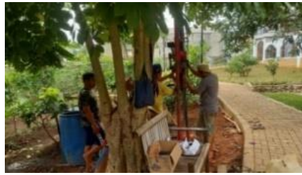
Gambar 4 Observasi Lahan

Kegiatan observasi lahan ini dilakukan pada tanggal 2-6 Agustus 2023, pukul 08.00-13.50 WIB, di lahan pertanian taman Cempaka. Kegiatan dimulai dengan dilakukannya pengeboran sumur, pemasangan mesin pompa air, penginstalasian saluran air terhadap pengeboran sumur. Hal ini dilakukan agar memudahkan mitra dalam pengambilan sumber air untuk proses penyiraman tanaman. Kemudian kegiatan dilanjutkan dengan pembersihan lahan, penggarapan terhadap lahan, dan pembuatan bedengan dan jalur penanaman. Hasil dari kegiatan ini yakni sumur untuk pengairan ke lahan pertanian sudah dapat dimanfaatkan oleh PKK RW 04 maupun masyarakat umum setempat dan sebagian lahan sudah lebih tertata rapi serta bebas dari gulma.