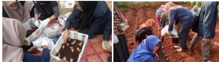
Gambar 5 Pelatihan Pembudidayaan Tanaman Rimpang

Kegiatan pelatihan pembudidayaan tanaman rimpang ini dilakukan pada tanggal 27 Agustus dan 3 September 2023, pukul 16.00-17.00 WIB. Kegiatan berlangsung di lahan pertanian taman Cempaka bersama anggota PKK RW 04. Rincian dari kegiatan ini adalah tim menyampaikan mekanisme cara menyemai jahe dan serai kepada mitra, yaitu untuk penyemaian jahe adalah dengan menyiapkan bibit jahe yang akah disemai, lalu bibit dibagi menjadi 3-4 mata tunas, kemudian bibit direndam larutan bakterisida dan fungisida selama 3 jam, setelah itu jahe disusun di media semai hingga tumbuh tunas dan siap ditanam. Setelah itu tim menyampaikan mekanisme penyemaian serai, langkah-langkahnya adalah dengan memotong serai kurang lebih sebanyak 10 cm, kemudian rendam serai ke dalam ember berisi air hingga tumbuh akar.