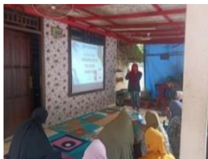
Gambar 1 Sosialisasi Pengenalan Program

Kegiatan sosialisasi ini dilakukan pada tanggal 14 Juli 2023, pukul 14.00-15.10 WIB, bertempat di kediaman ketua RW 04 Cilangkap. Kegiatan dimulai dengan pembukaan dari MC, sambutan dari ketua tim dan sekretaris PKK RW 04 yang menyampaikan antusiasme