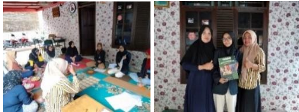
Gambar 8 Monitoring dan Evaluasi

Kegiatan monitoring dan evaluasi ini dilakukan pada tanggal 29 September 2023, pukul 16.00-17.30 WIB, yang berlangsung di kediaman Ketua RW 04 Cilangkap. Rincian dari kegiatan ini adalah dilakukan monitoring dan evaluasi kegiatan yang telah dilakukan. Setelah itu, tim melakukan pengaderan pada program PKM-PM yang telah terlaksana, selanjutnya penutupan kegiatan dari program rimpang instant healthy drink yang telah dilaksanakan selama 3 bulan. Pada akhir kegiatan, tim menyerahkan buku pedoman mitra dan LPJ untuk mitra, serta tim memberikan kuesioner kepada anggota PKK RW 04 untuk proses evaluasi.