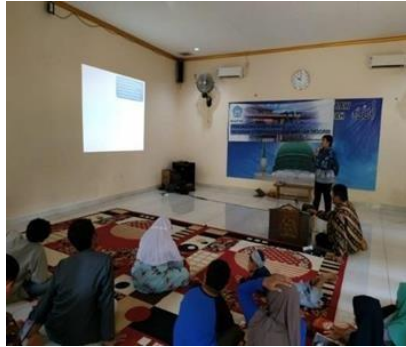
Gambar 1. Pemberian Materi Program Pencegahan Narkoba

membantu para remaja maupun pemuda untuk mencegah penyalahgunaan narkoba, seperti organisasi pemuda, orang tua, tokoh masyarakat, para guru, pemerintah. Pencegahan ini dapat dilakukan dengan memberikan penyuluhan secara berkala serta ikut bertoleran aktif dalam kegiatan pencegahan ini (BNN, 2004).