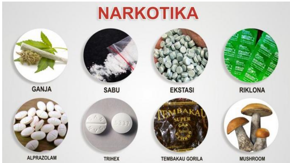
Gambar 2. Berbagai macam Narkotika

Peserta penyuluhan diberikan beberapa arahan mengenai rincian kegiatan apasaja yang akan dilakukan selama penyuluhan yang disampaikan oleh tim pengabdian masyarakat berlangsung.