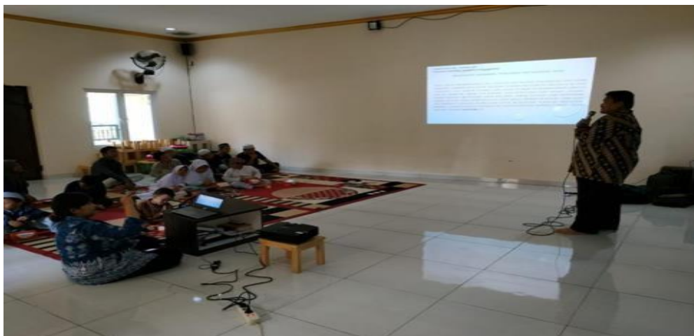
Gambar 3. Pemberian Materi Penyuluhan Pengaruh Narkoba Ketahanan NKRI

Materi pertama yang disampaikan oleh tim pengabdian kepada masyarakat disampaikan melalui slide powerpoint dalam sosialisasi ini adalah pemahaman narkoba dan pengaruh narkoba bagi ketahanan NKRI dan Efek yang ditimbulkan dari penggunaan narkoba oleh tim.