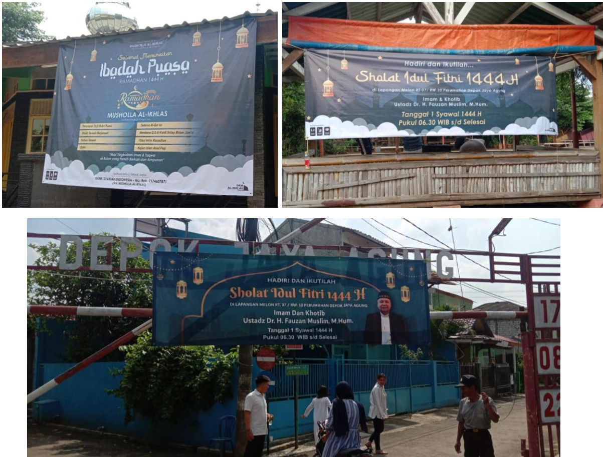
Gambar 7 Spanduk yang telah terpasang di lingkungan Depok Jaya Agung

masyarakat. Dan tambahan lentera, jauh sebelum adanya listrik, dahulu masyarakat menggunakan lentera sebagai penerangan pada malam hari. Sedangkan warna kuning untuk warna tulisan berguna untuk menjadi pusat perhatian pembaca. Untuk tipografi sendiri menggunakan jenis klasifikasi sans serif dimana menurut Cronin (Rosita, 2022) bila kalimat maupun paragraf informasi bila menggunakan klasifikasi jenis sans serif akan mudah untuk dibaca dan mata lebih mudah untuk mengenali huruf.