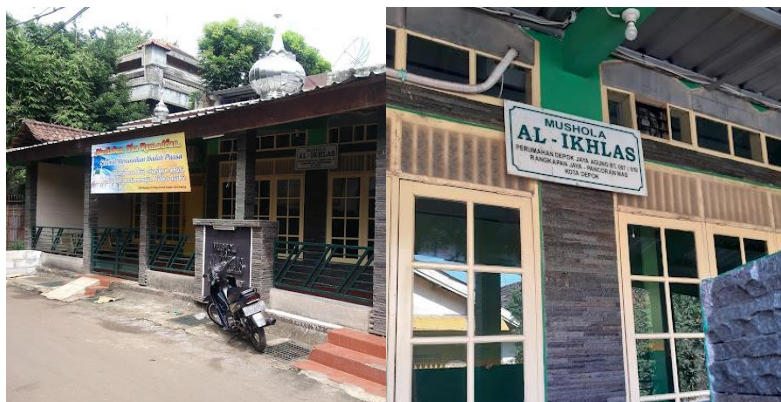
Gambar 5 Musala Al-Ikhlash