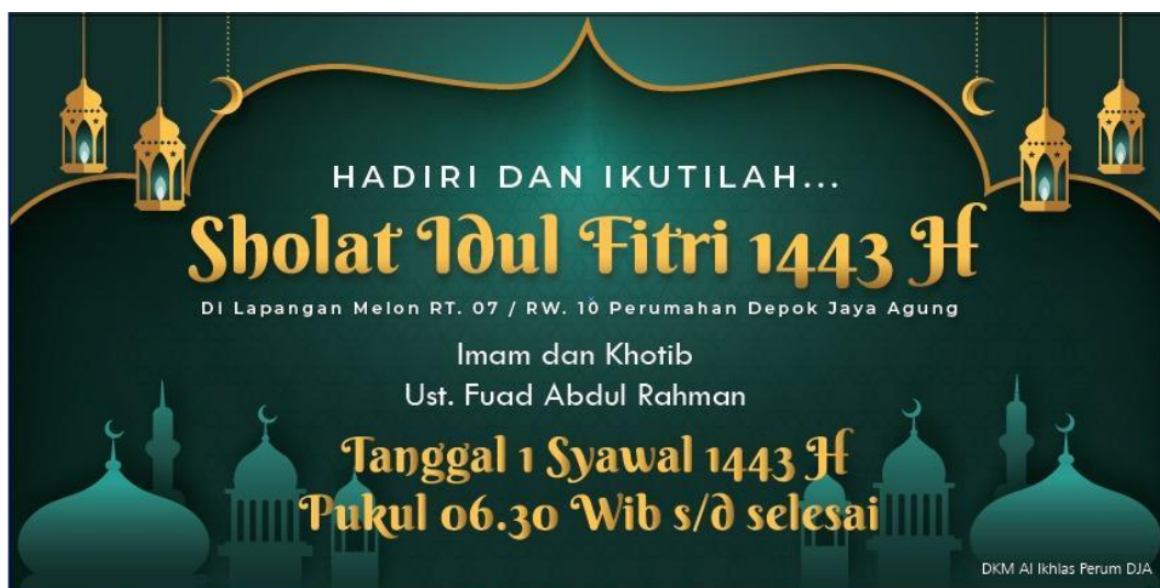
Gambar 3 Spanduk Sholat Idulfitri Musala Al-Ikhlash