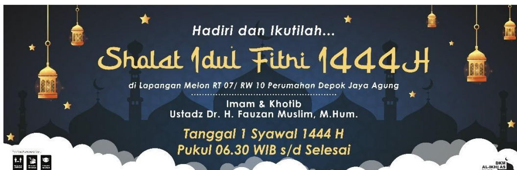
Gambar 2 Spanduk Sholat Idulfitri Musala Al-Ikhlash