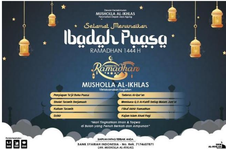
Gambar 1 Spanduk Kegiatan Ramadan Musala Al-Ikhlash