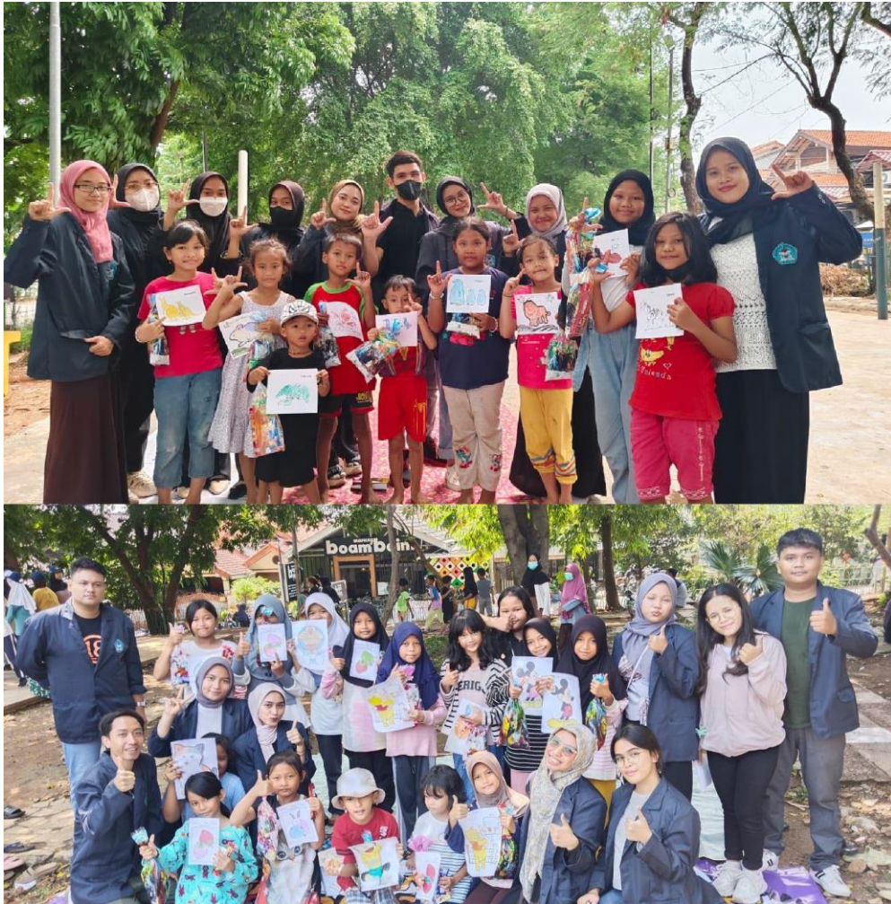
Gambar 3 Foto Bersama Setelah Kegiatan Selesai