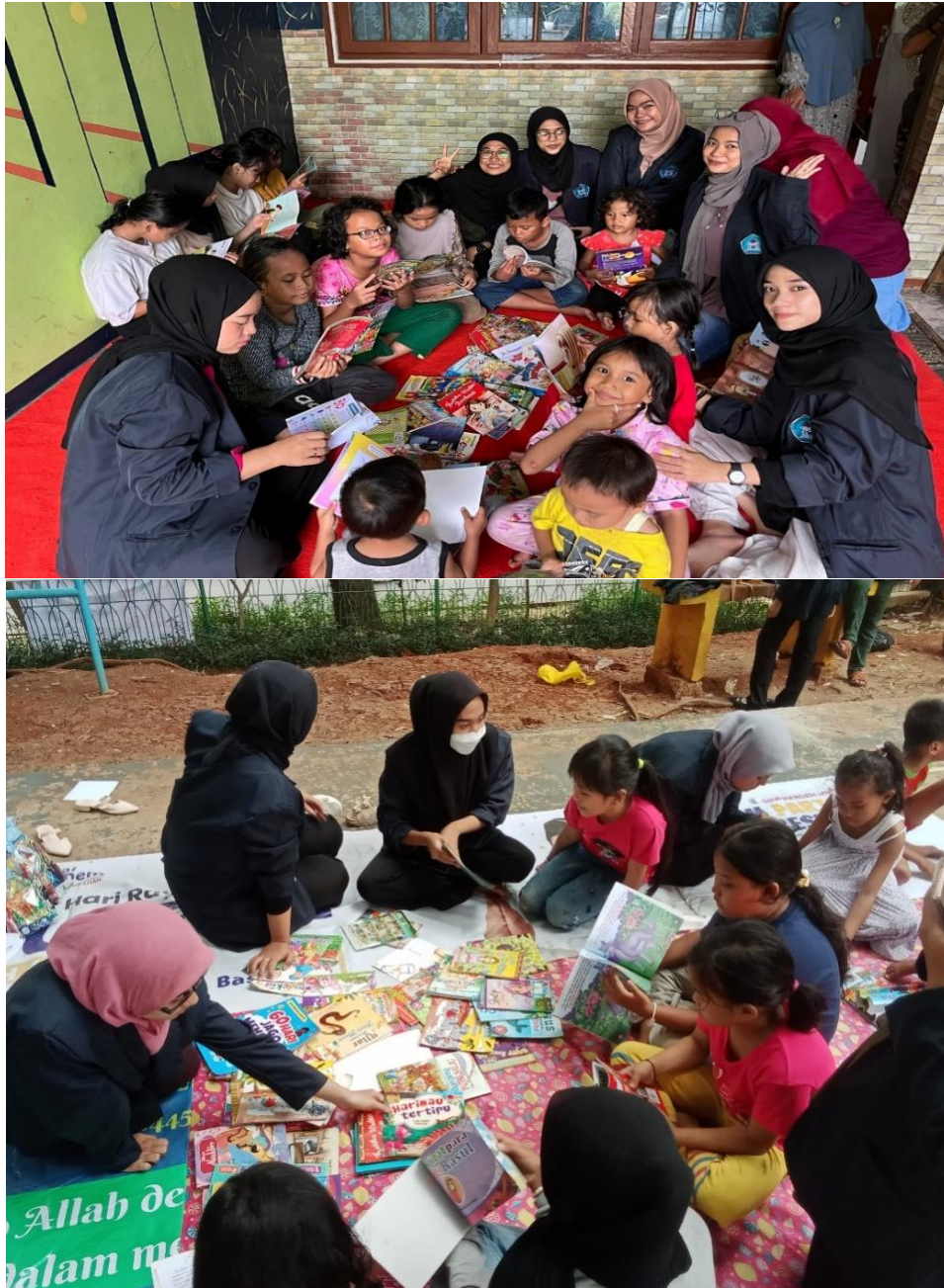
Gambar 2 Kegiatan Membaca Berkala