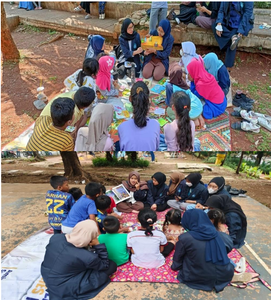
Gambar 1 Kegiatan Membaca dan Bercerita

Kegiatan pengabdian kepada masyarakat ini diikuti oleh 35 anak usia sekolah dasar yang tinggal di sekitar tempat pelaksanaan kegiatan literasi, Ada 15 anak laki-laki dan 20 anak perempuan. Waktu pelaksanaan kegiatan Abdimas ini dilakukan setiap Sabtu pada pukul 15.00 hingga pukul 17.00 WIB dan Minggu dimulai pukul 08.00 hingga pukul 10.00 WIB. Dalam waktu itu, anak-anak dapat melakukan kegiatan literasi membaca dan literasi berhitung dengan semangat dan senang hati. Minat anak-anak terhadap membaca sangat baik. Mereka menikmati kegiatan membaca bersama teman-temannya. Selain itu, mereka dapat memahami proses membaca dengan beberapa bentuk variasinya. Mereka juga sudah dapat memahami bahwa pentingnya membaca buku setiap hari agar pengetahuan mereka bertambah luas.